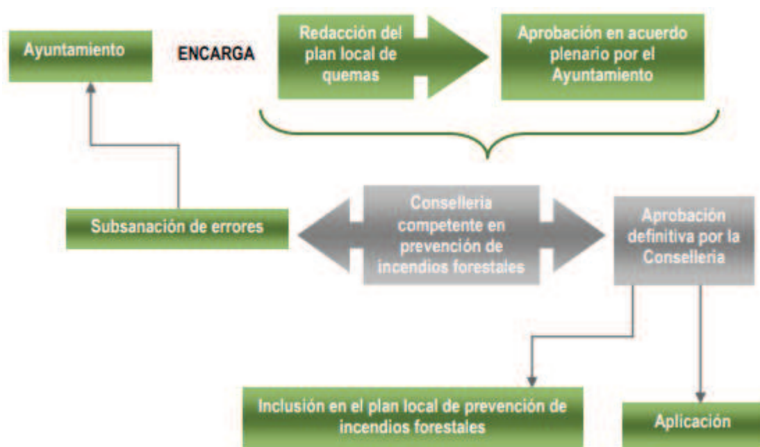
Ilustración 1: Esquema de aprobación del plan local de quemas, según el PPI de la Demarcación Forestal de Xàtiva.

Este plan deroga anteriores planes, así como cualquier normativa municipal anterior sobre la misma materia que se oponga al mismo.