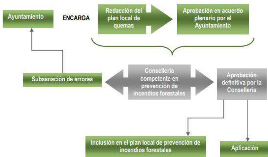
Ilustración 1: Esquema de aprobación del plan local de quemas, según el PPI de la Demarcación Forestal de Alcoy.

Este plan deroga anteriores planes, así como cualquier normativa municipal anterior sobre la misma materia que se oponga al mismo.